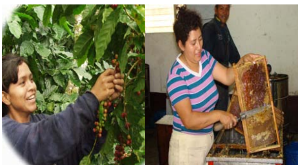
Productoras de café y miel orgánica

El 24 de junio realizaron el primer foro expositivo sobre la Promoción del Desarrollo Cooperativo con enfoque de género y responsabilidad ambiental, con el apoyo de Oxfam América y FUMDEC.