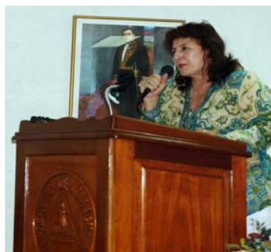
Sra. Jeannette Chávez, Ministra de Trabajo

Las conclusiones señaladas en el estudio es que las trabajadoras domesticas son desvalorizadas por la sociedad, que son discriminadas al llamarlas "sirvientas" dentro del clasificador de ocupaciones y se les considera de bajo nivel educacional, aunque en esta ocupación laboren hasta profesionales, éstas experimentan la violación a sus derechos laborales.